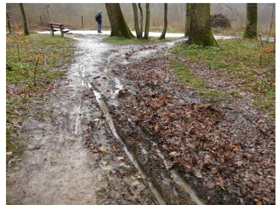
Fussweg bei nassem Wetter: Vernässungen und Umgehungspuren