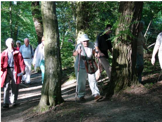
Basler Botanische Gesellschaft, Exkursion