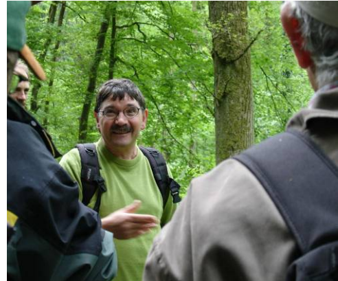
Exkursion im Mai 2006 mit dem baden-württembergischen Forstverein