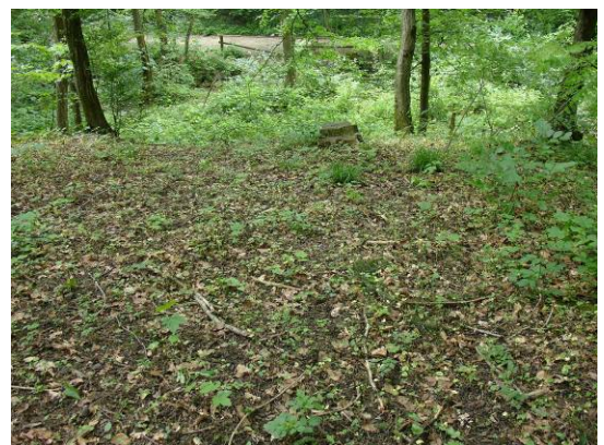
Gebiet neben der Versuchsfläche