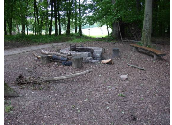
gut ausgestattete offizielle Feuerstelle