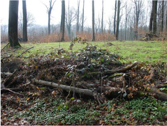
Asthaufen als Lenkungsmassnahmen an Verjüngungsflächen