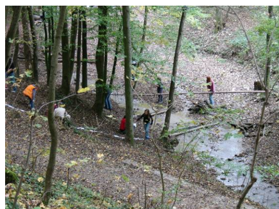
Pfadigruppe am Dorenbach