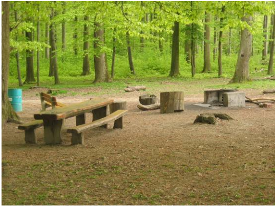
gut ausgestattete offizielle Feuerstelle