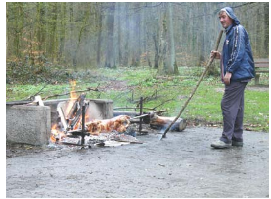
Nutzung auch bei schlechtem Wetter