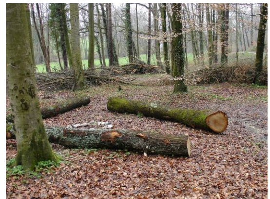
mit Brennholz in der Nähe