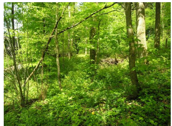
gut entwickelte Waldvegetation, Mai 2006