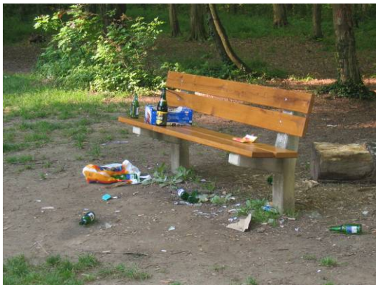
nach einem Schönwetter-Wochenende