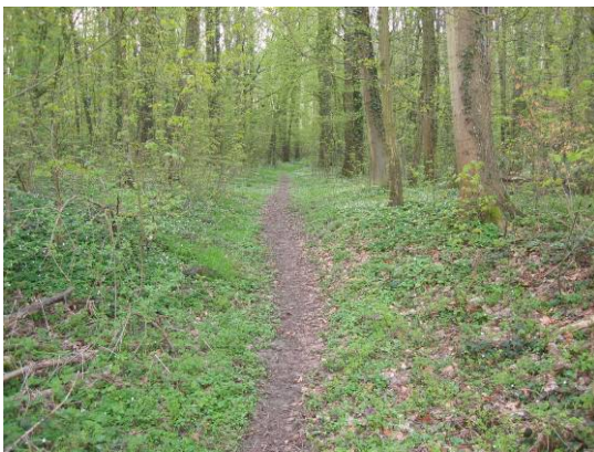
Fusspfad im Bestand