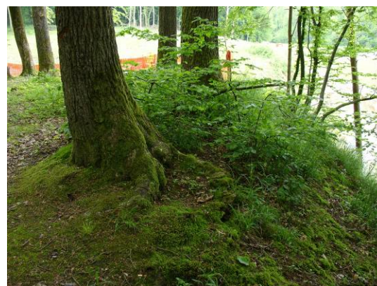
Böschungsoberkante, in Allschwil seltene saure Waldgesellschaften mit typischen Zeigerpflanzen