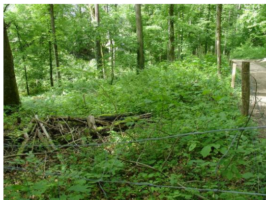
Dorenbach: eingezäunte Versuchsfläche mit üppiger Bodenvegetation und Naturverjüngung