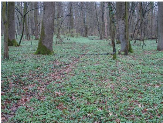
wenig benutzter Fusspfad, der allmählich wieder verschwindet