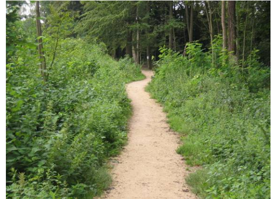
befestigter Fussweg, seitlich dichte Kraut- und Strauchschicht