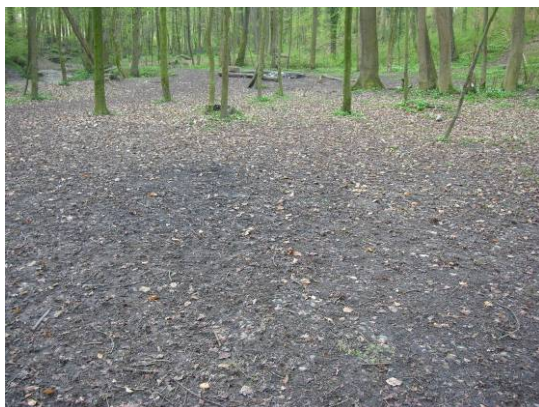
stark begangenes Waldgebiet mit spärlichen Resten von Bodenvegetation, April 2006