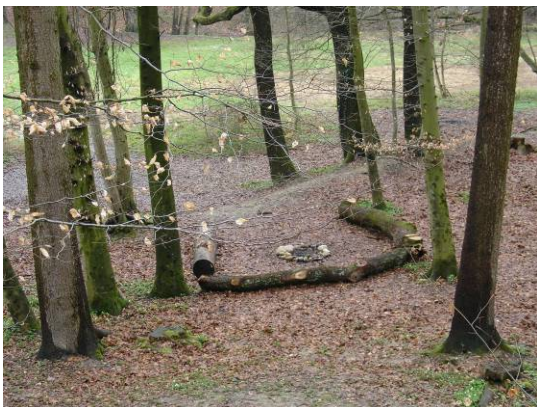
Feuerstelle Typ 2, Versuchsbetrieb 2006