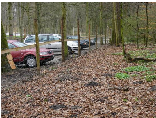
einfache Abschränkung von Parkplätzen