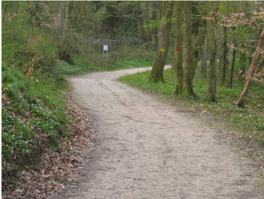
befestigter Waldweg (lastwagenfahrbar)