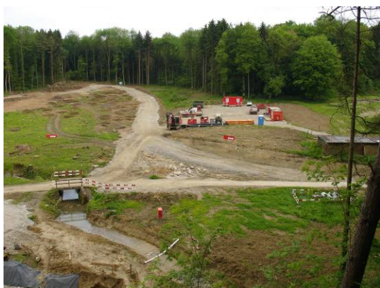
Standort des neuen Hochwasserschutzdammes (Mai 2006)

Im Mülitäli müssen Beobachtungs- Zugangs- und ev. Querungsmöglichkeiten zu den neuen Feuchtstandorten angeboten werden, ev. Stege und Beobachtungsplattformen. Dabei müssen Wald und offene Flächen einbezogen werden.